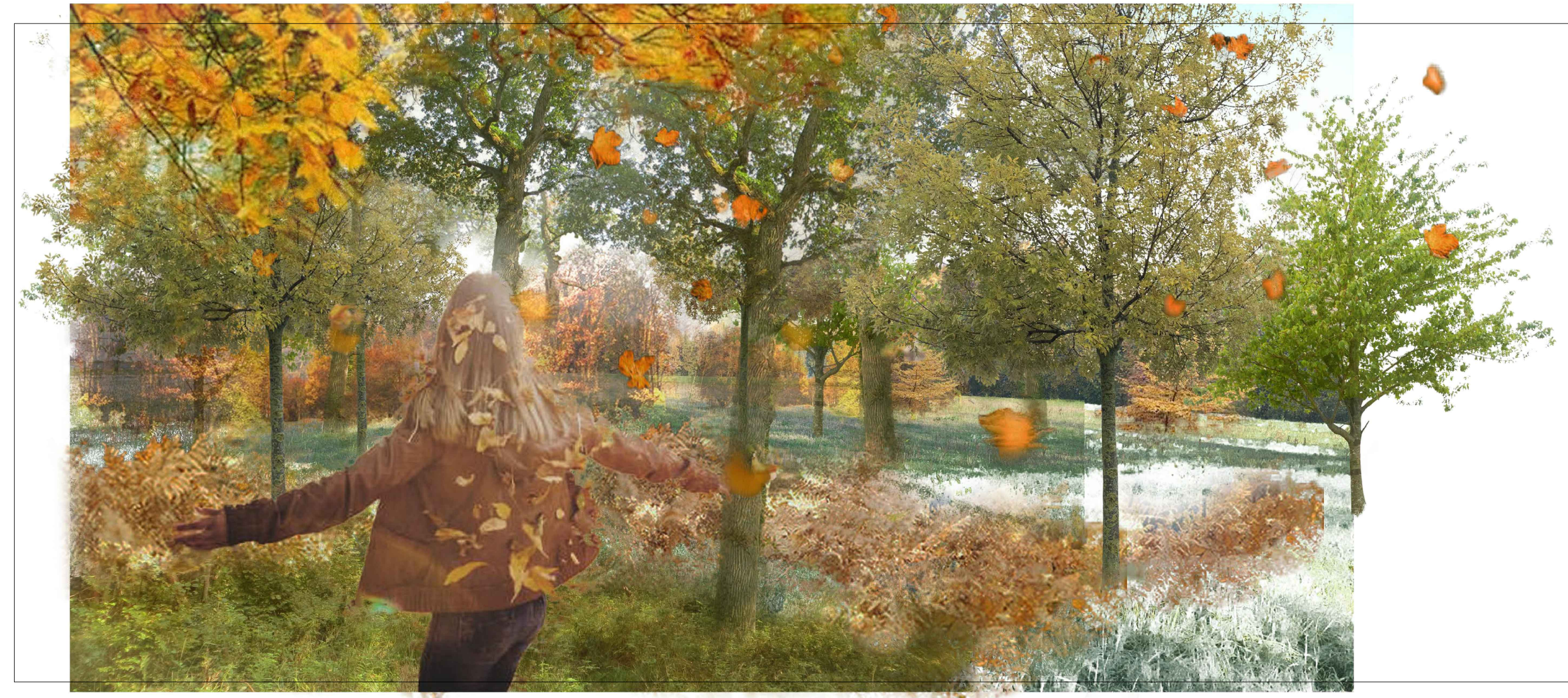
Area verde - stagione: autunno - vista da via Zappiano verso via delle Trecciaiole