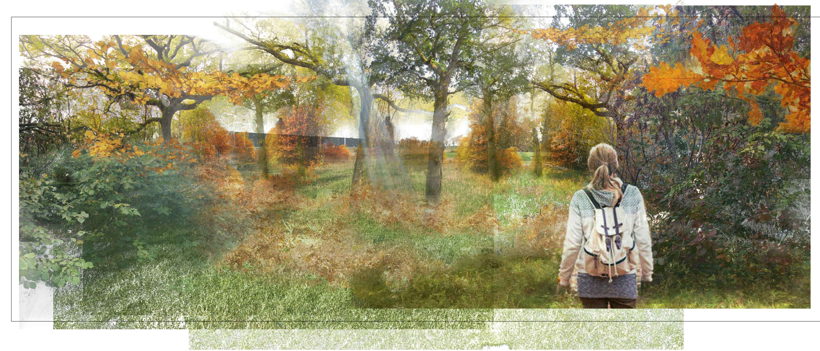
Area verde - stagione: autunno - vista da via Zappiano verso via degli Inventori

A termini delle vigenti leggi sui diritti d'autore, questo documento non potrà essere copiato, riprodotto e comunicato ad altri senza l'autorizzazione della "KIT MARKETING"