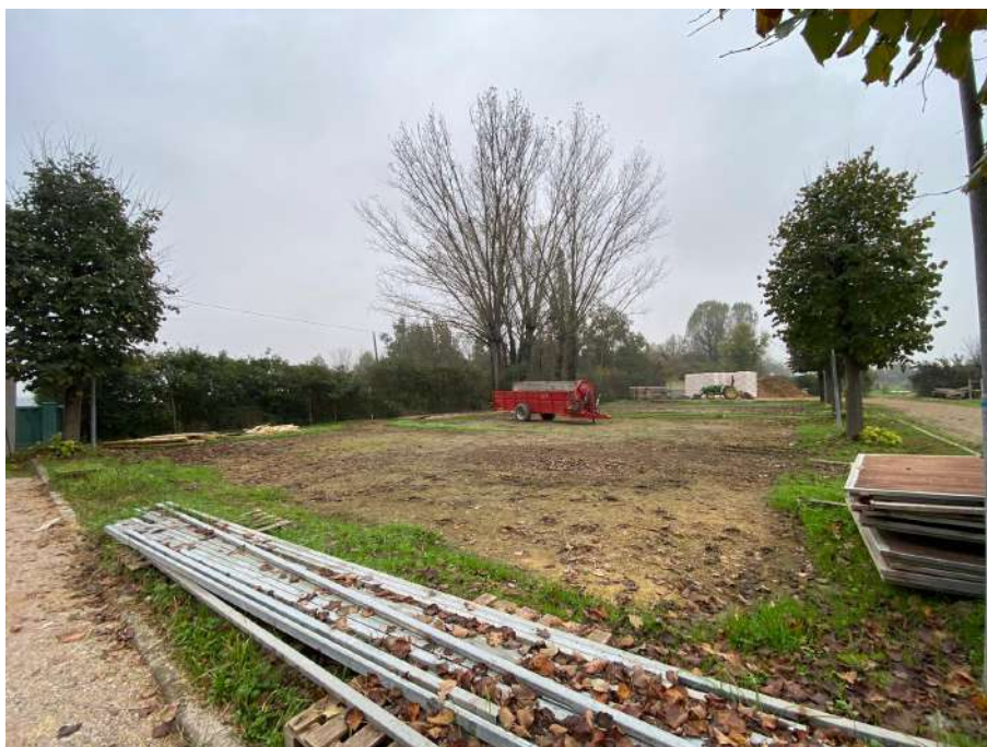
Area destinata all'opera di progetto n.2, stalla.