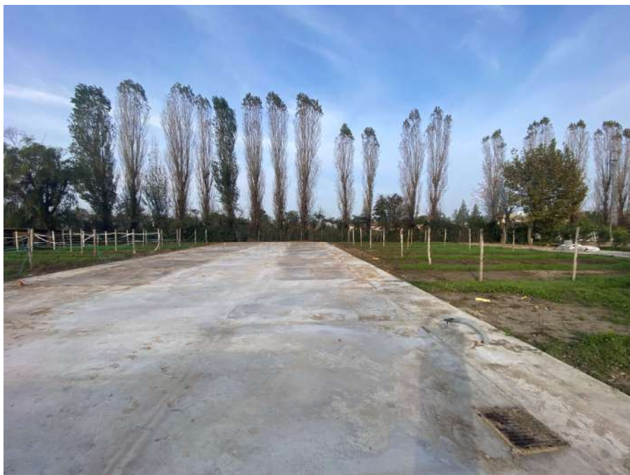
Area destinata all'opera di progetto n.3bis, fienile.