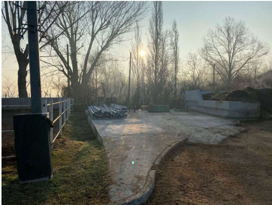
Area destinata all'opera di progetto n.4, letamaia.