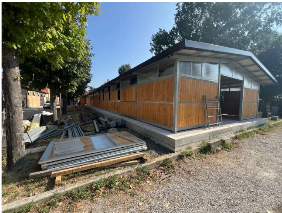
Opera temporanea che diventerà definitiva, n.1.