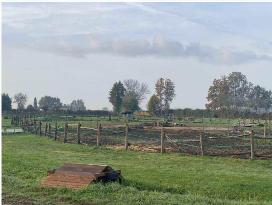
Area destinata all'opera di progetto n.6, stalla.