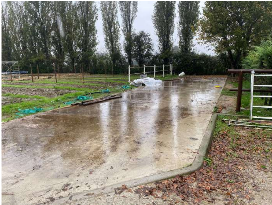
Area destinata all'opera di progetto n.3, fienile.