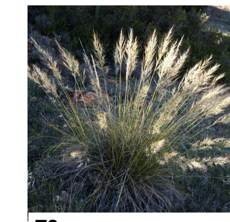
T2 STIPA TENACISSIMA