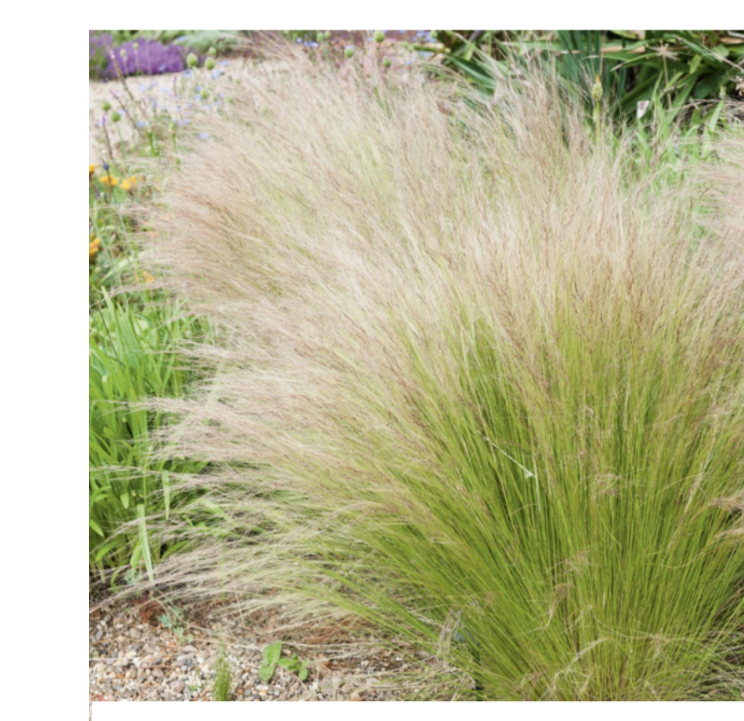
T1 STIPA TENUISSIMA