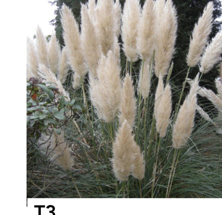
T3 ERBA DELLA PAMPA