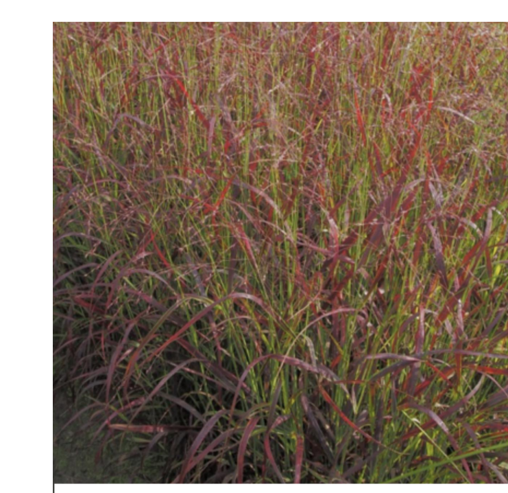
T7 PANICUM VIRGATUM