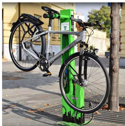
Colonnine manutenzione bici