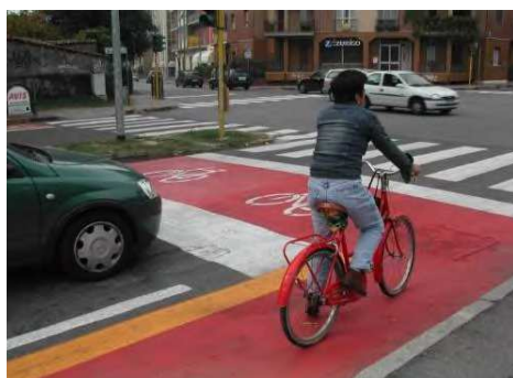
Esempio di "casa avanzata"